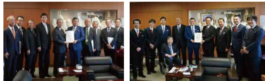
自治体や団体から、国土交通省管轄案件についての要望を伺います。 抱えている課題の現状を聞いて、対策やこれからの展望について意見交換をします。