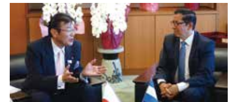
海外からの国賓・来賓の方々和我が国の国土交通政策について説明をして意見交換・情報交換を行います。皆様、日本の技術力には大変驚かれます。成長戦略である日本の高水準技術のインフラ輸出を促進する為に積極的に海外へPRします。