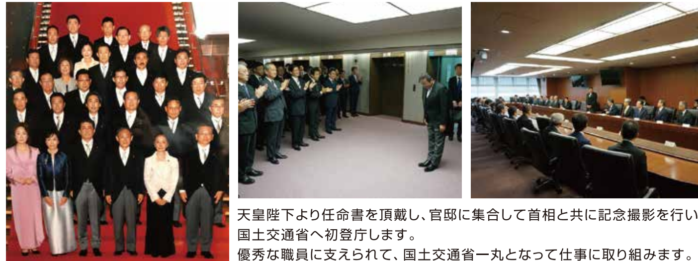
天皇陛下より任命書を頂戴し、官邸に集合して首相と共に記念撮影を行い国土交通省へ初登庁します。 優秀な職員に支えられて、国土交通省一丸となって仕事に取り組みます。