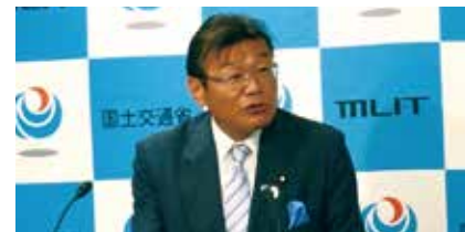
様々な角度からの質問がありました。今ご自身が考えていることを話されました。特に興味のある分野という質問には、自動運転などのこれから展開されていく分野で、安全を担保しながら利便さを追求していきたいとのことでした。