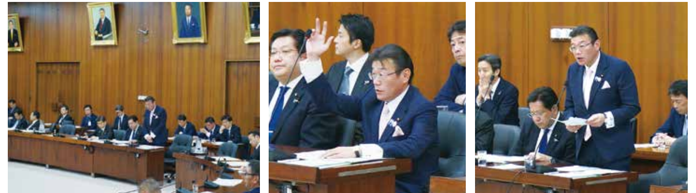
質疑とは本会議や委員会の議事手続において討論や表決に入る前に当該事項について、口頭で質疑提案者等に対して説明や所見を求め疑義を質すことです。 質問の意義を理解し、国土交通省を代表する立場で的確に答えます。