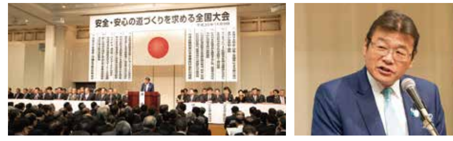
海外からの国賓の来日や会議・団体の大会が開催された場合、主催や来賓として挨拶や会談する機会が多く、貴重な情報交換や顔合わせの場となります。