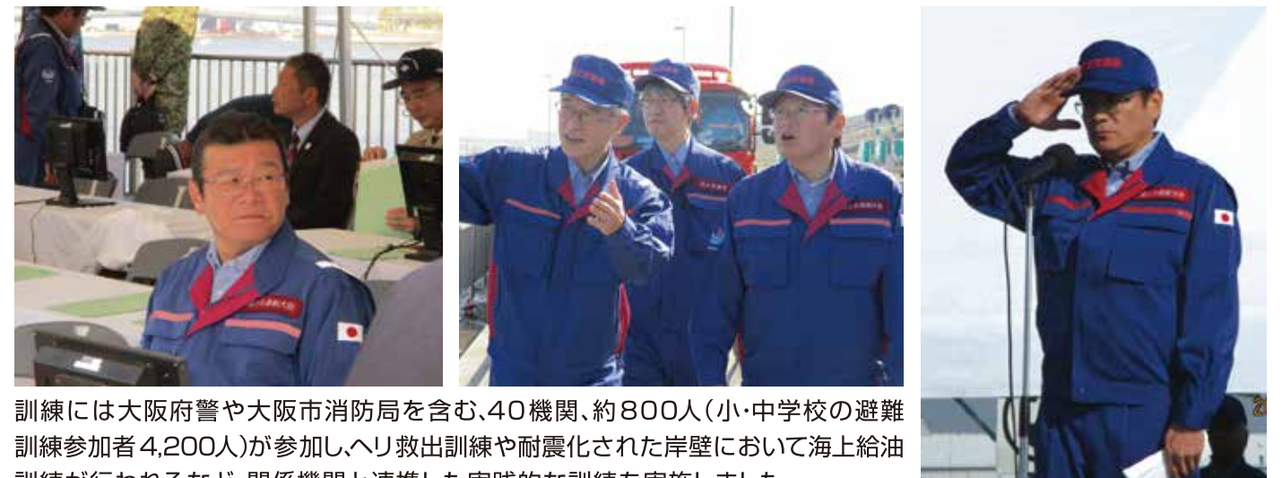
訓練には大阪府警や大阪市消防局を含む、40機関、約800人(小・中学校の避難訓練参加者4,200人)が参加し、ヘリ救出訓練や耐震化された岸壁において海上給油訓練が行われるなど、関係機関と連携した実践的な訓練を実施しました。